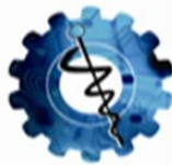
TABLA DE DISECCIÓN.